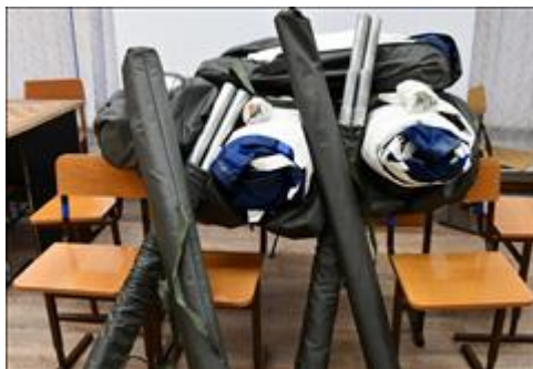
катамараны 4 катамарана для проведения водных походов

катриджей Маркеры цветные для письма на белой доске Пленка для ламинатора Ручки, карандаши