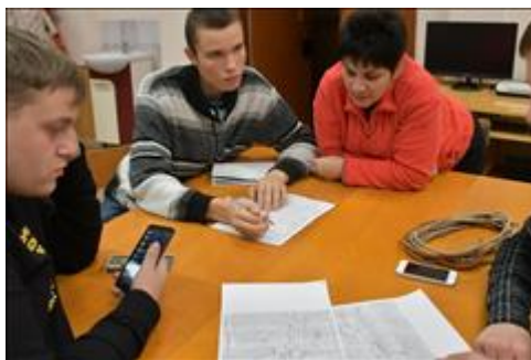
Обсуждение ПВД Практическое занятие по организации ПВД. Обсуждение маршрута в группе.