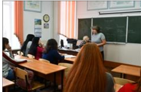
МБОУ СОШ №25 Встреча с обучающимися