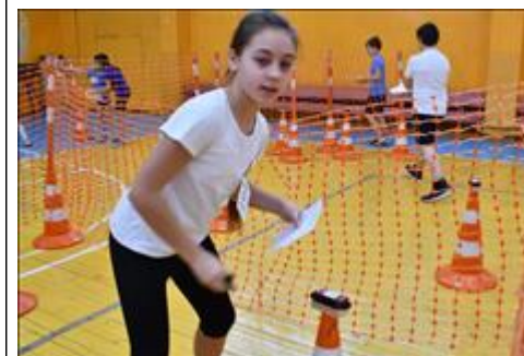
В поисках КП Крещенский лабиринт 18.01.2020