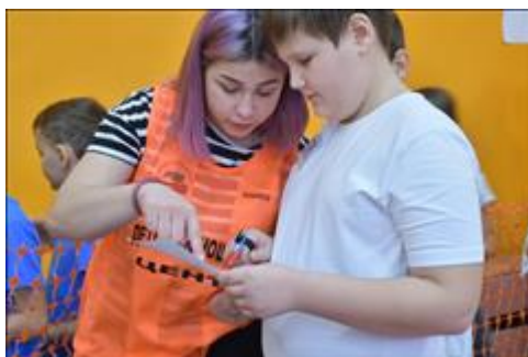
Без помощи инструктора нам не справиться... Крещенский лабиринт 18.01.2020