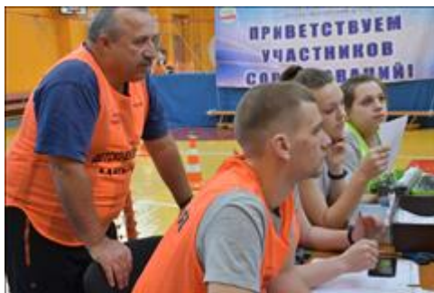
Строгие судьи Крещенский лабиринт 18.01.2020