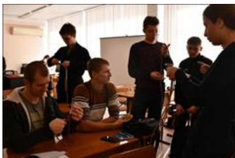
Туристские узлы Практическое занятие "Туристские узлы"