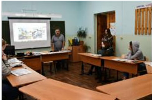
МБОУ СОШ №24 Встреча с обучающимися