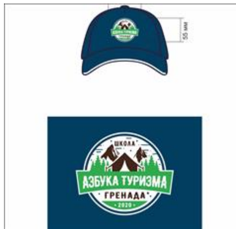
Макет бейсболки В комплект спортивной одежды входят: футболка, толстовка и бейсболка