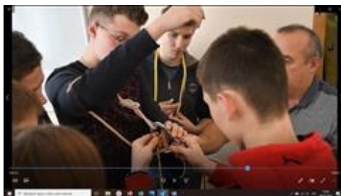
Работа с веревками, карабинами. Практическое занятие "Туристские узлы"