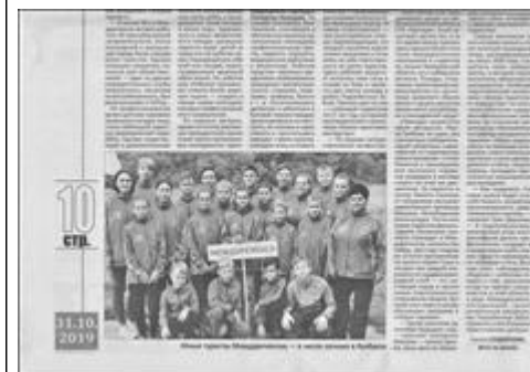
Статья в газете Знамя шахтера, 2 часть Газета "Знамя шахтера в новом тысячелетии", № от 31 октября 2019 г.