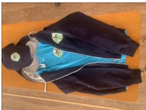
Форма (комплект) Комплект формы для слушателей, успешно прошедших Школу "Азбука туризма"