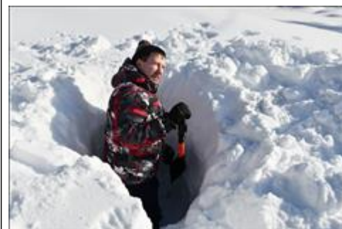
Строительство снежного укрытия Практическое занятие