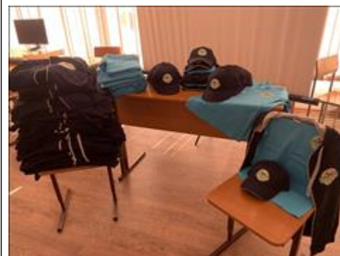
Форма 30 комплектов формы для слушателей и преподавателей Школы "Азбука туризма" (футболки, толстовки, бейсболки)