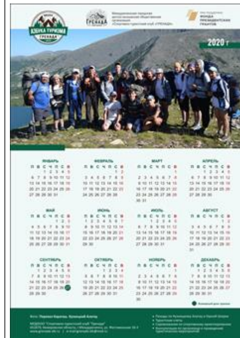
Календарь на 2020 г. Календари с логотипом проекта были распространены среди учреждений города.