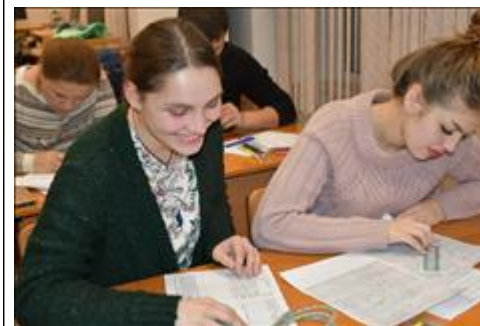
Измерение протяженности маршрута. Практическое занятие по работе с картой, измерение протяженности маршрута.