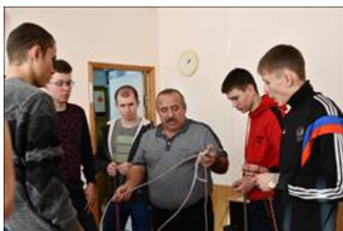
Работа с веревками (узлы) Практическое занятие "Туристские узлы"