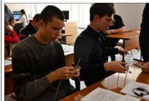
Закрепление навыков по завязыванию основных узлов Практическое занятие "Туристские узлы"