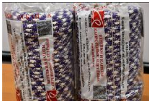
веревка вспомогательная Для проведения различных туристических мероприятий с использованием веревок.