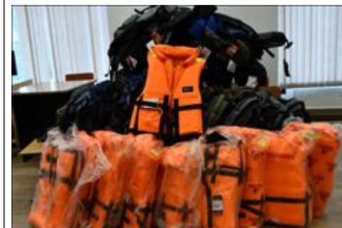
спальники и спасжилеты личное снаряжение для безопасности туристов