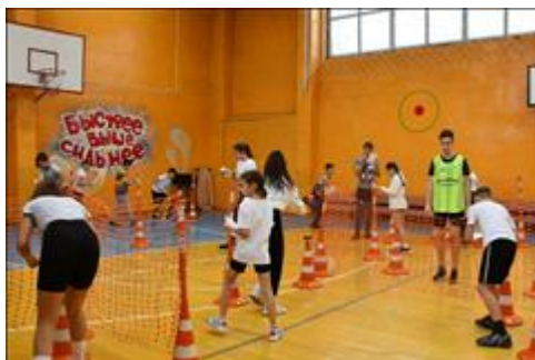
Лабиринт Крещенский лабиринт 18.01.2020