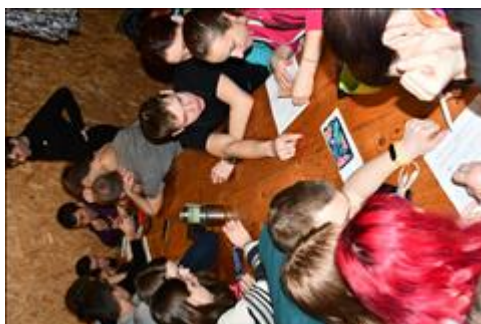
Работа с топографическими знаками. Практическое занятие