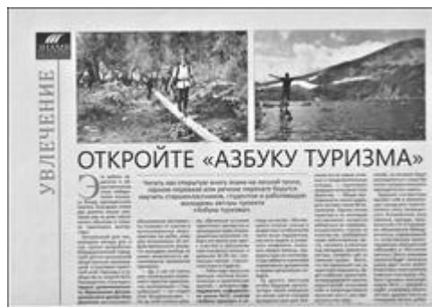
Статья в газете Знамя шахтера, 1 часть Газета "Знамя шахтера в новом тысячелетии", № от 31 октября 2019 г.