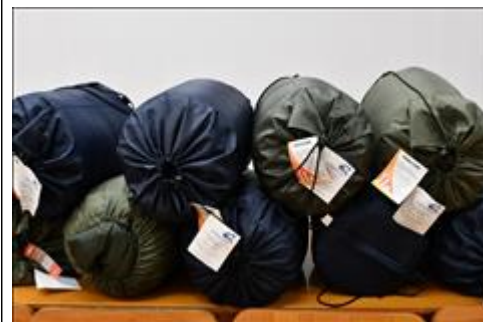
спальники 10 спальников