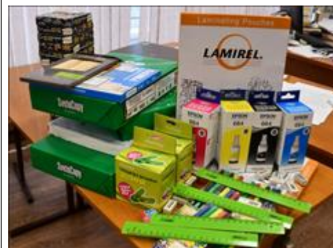
канцтовары Бумага ксероксная (белая - 4 пачки и цветная - 1 пачка плотностью 80 г, 1 пачка плотностью 160 г.) Заправка