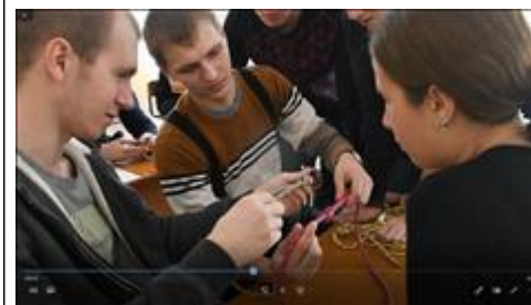
Узлы Практическое занятие "Туристские узлы"