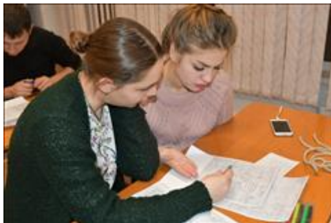
Прокладка маршрута Практическое занятие по работе с картой, прокладка маршрута.