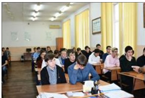
МГСТ Студенты 3 курса