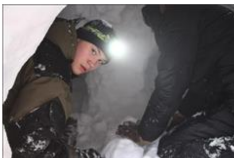
Строительство зимнего укрытия Практическое занятие