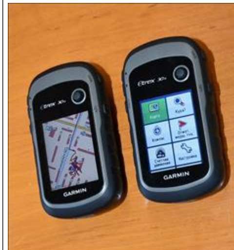
навигаторы Навигаторы нужны для построение треков, фиксации маршрутов.

катриджей Маркеры цветные для письма на белой доске Пленка для ламинатора Ручки, карандаши