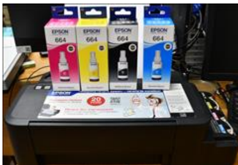
тонер для принтера Принтер предоставляет социальный партнер (МБОУ СОШ №22") для печати грамот, буклетов, различных материалов для слушателей курса