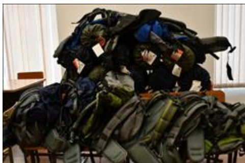
рюкзак и спальники для проведения походов