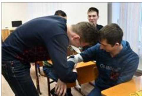
Перевязки. Практическое занятие по основа оказания первой доврачебной помощи.