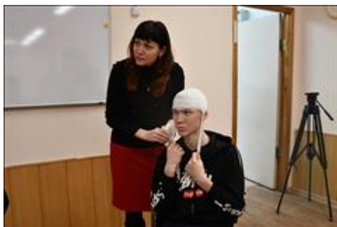
Оказание первой доврачебной помощи Практическое занятие по основа оказания первой доврачебной помощи.