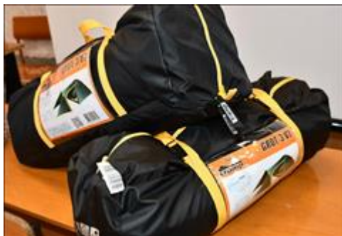
палатки трекинговые Во время проведения практических занятий на природе, прохождения туристических маршрутов, совершения пеших и водных походов клуб обеспечивает участников необходимым туристическим оборудованием.