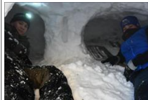
Зимнее укрытие Практическое занятие по строительству зимнего укрытия. Было построено 3 зимних укрытия (работа в группах).