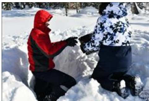
Строительство зимнего укрытия Практическое занятие