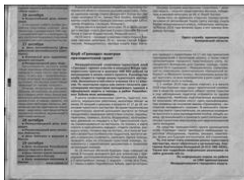
Заметка в городской газете "Контакт" Газета "Контакт", номер 82 от 24 октября 2019 г.