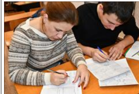
Заполнение маршрутного листа Практическое занятие по заполнению заявочных документов, в т.ч. маршрутного листа похода выходного дня.