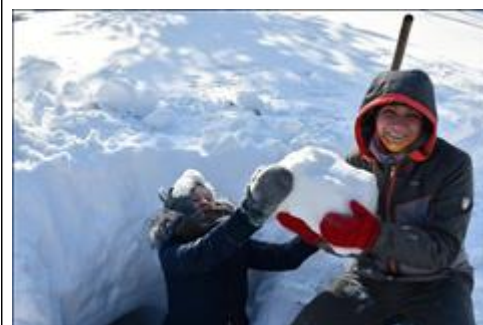
Строительство зимнего укрытия Практическое занятие