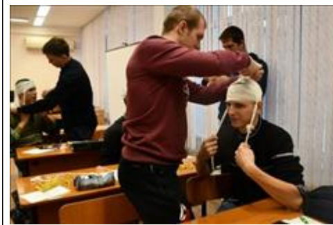
Виды перевязок Практическое занятие по основа оказания первой доврачебной помощи.