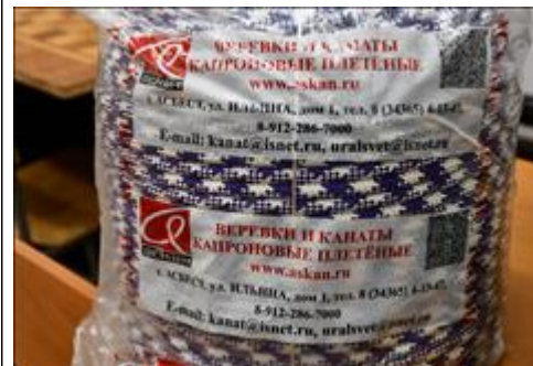
Веревка основная Отработка различных походных ситуаций: подъемы и спуски, переправы