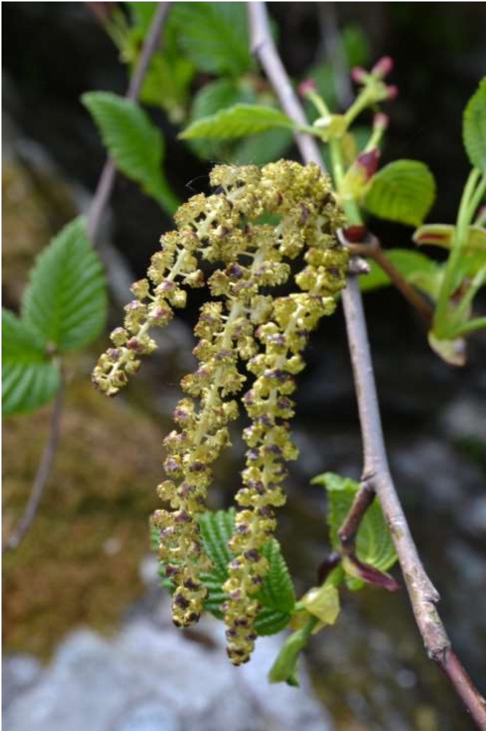
Шелест Валерия «Сережки»