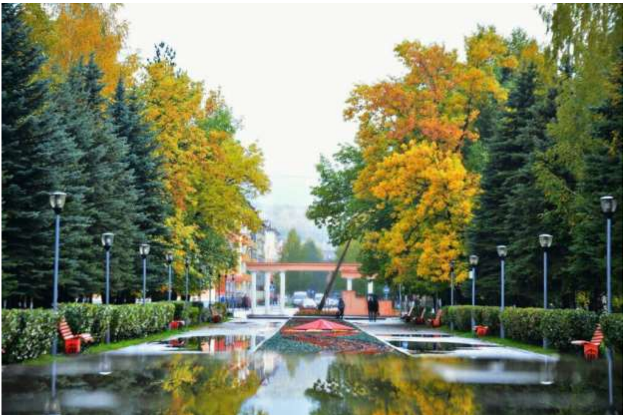
Зорина Ксения «Аллея Победы»